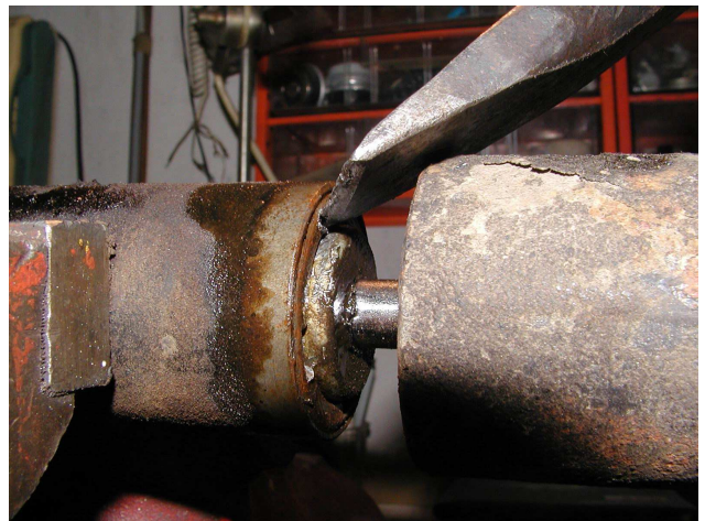
Obr.3 Matice a její povelení