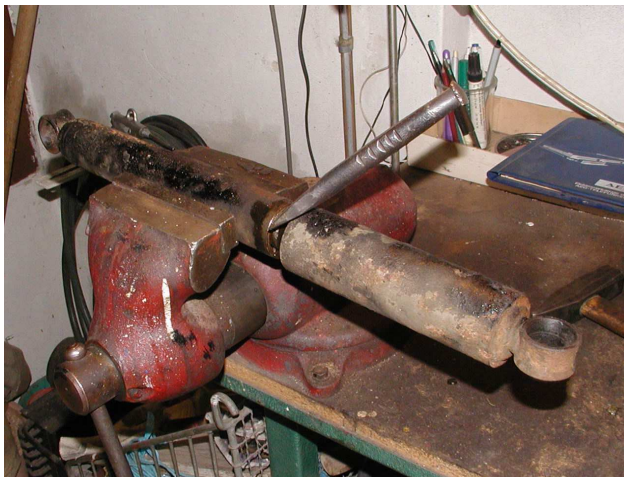
Obr.2 Uchycení tlumiče

Po vymontování tlumiče z auta jej roztáhneme na maximum a chytíme do svěráku tak, aby nedošlo k deformaci pouzdra tlumiče (vnější válec). Prostříkáme olejem (WD, Konkor..) maticí, která drží pístnici (viz. Obr.3). Ne však všechny tlumiče jsou rozebíratelné, pozor na to! Na odšroubování matice je potřeba speciální klíč. Ten si můžeme vyrobit dle Lada bible od pana Tůmy, či použít majzlík a kladivo. Já použil majzlík, ovšem je potřeba brát zřetel na to, že se jedná o trošku brutálnější, leč funkční, způsob. Proto pracujeme z citem.