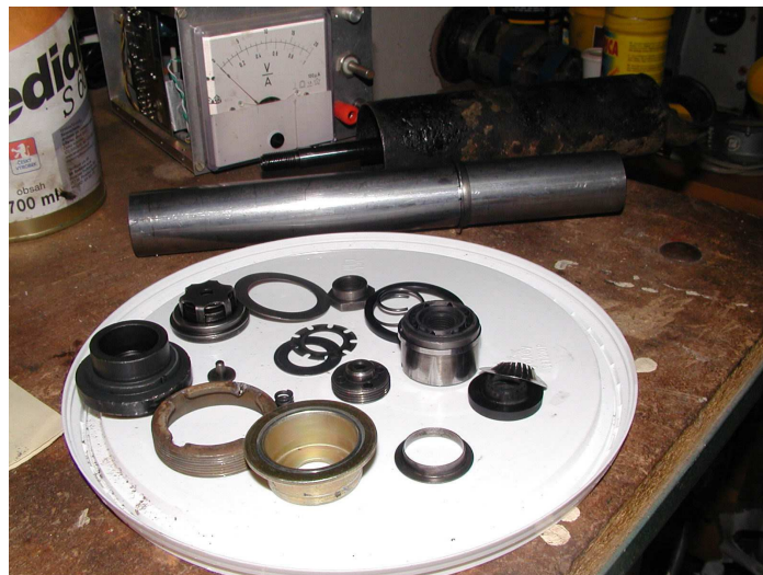
Obr.8 Vyčištěné součásti tlumiče

Po kompletním rozebrání tlumiče veškeré díly řádně propereme v odmašťovači (benzinu, lihu, apod.). Pro správnou funkci tlumiče je důležité, aby byly všechny díly naprosto čisté, bez předchozích usazenin. Proto po vyčištění doporučuji hůře dostupné součástky profoukat kompresorem. Před samotným skládáním můžeme rovněž řádně očistit vnější válec (pouzdro) tlumiče a opatřit ho nátěrem. Před montáží proto, aby se nám nedostaly nečistoty na pístnici či snad i přímo do tlumiče. Ovšem to jen moje doporučení. Při skládání postupujeme opačným způsobem a dbáme na to, abychom si různé součástky nepopletli. Předtím, než tlumič uzavřeme, naplníme jej stanoveným obsahem tlumičové kapaliny. Osobně doporučuji kapalinu pro motokrosově motocykly (např. ESSO Fork Oil Sport 15W-30) či sportovní tlumiče. Méně kvalitní tlumičové oleje se totiž při rychlém pérování mohou zpěnit, čímž ztrácí tlumič svoji schopnost dokonale tlumit. Nakonec nezapomeneme vyměnit vložky do oka tlumiče.