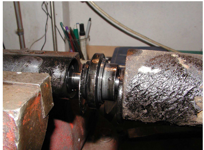
Obr.5 Vyjmutí horního ventilu[B]

Nyní můžeme z vnitřního válce vysunout pístnici s pístem tlumiče [C]. Píst se zbývajícími kroužky, podložkami, pružinkami ... je však na pístnici přišroubován. Prvně musíme odšroubovat z pístu spodní ventil a až poté celý píst (viz. Obr.7).