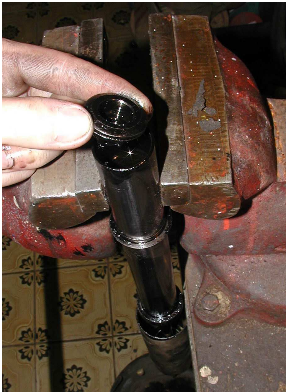
Obr.6 Vyjmutí spodního ventilu[A]