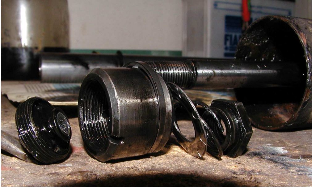
Obr.7 Rozebrání pístu tlumiče [C]

Po kompletním rozebrání tlumiče veškeré díly řádně propereme v odmašťovači (benzinu, lihu, apod.). Pro správnou funkci tlumiče je důležité, aby byly všechny díly naprosto čisté, bez předchozích usazenin. Proto po vyčištění doporučuji hůře dostupné součástky profoukat kompresorem. Před samotným skládáním můžeme rovněž řádně očistit vnější válec (pouzdro) tlumiče a opatřit ho nátěrem. Před montáží proto, aby se nám nedostaly nečistoty na pístnici či snad i přímo do tlumiče. Ovšem to jen moje doporučení. Při skládání postupujeme opačným způsobem a dbáme na to, abychom si různé součástky nepopletli. Předtím, než tlumič uzavřeme, naplníme jej stanoveným obsahem tlumičové kapaliny. Osobně doporučuji kapalinu pro motokrosově motocykly (např. ESSO Fork Oil Sport 15W-30) či sportovní tlumiče. Méně kvalitní tlumičové oleje se totiž při rychlém pérování mohou zpěnit, čímž ztrácí tlumič svoji schopnost dokonale tlumit. Nakonec nezapomeneme vyměnit vložky do oka tlumiče.