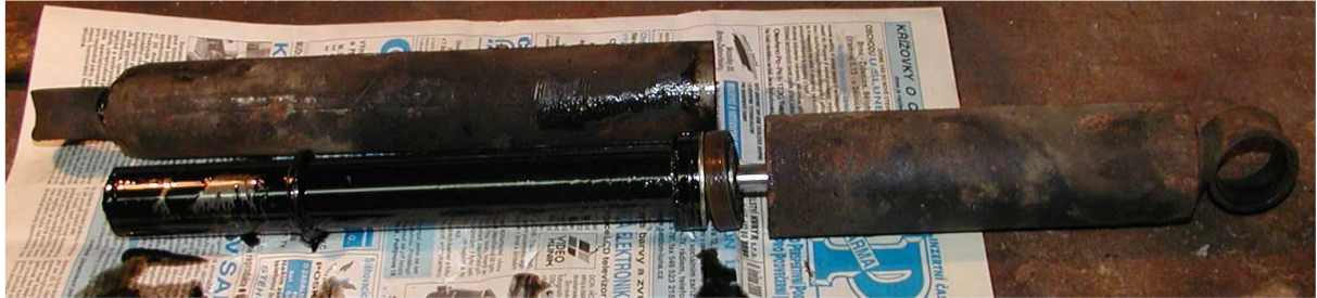
Obr.4 Vysunutí spodního pouzdra tlumiče

Po povolení matice vysuneme vnější válec (pouzdro) tlumiče. Ovšem zbytek tlumiče nám ještě drží pohromadě. Rozebrání je však již jednoduché. Spodní [B] i horní [A] ventil (obr.5 a 6) je ve válci pouze naklepnut, stačí s nimi lehce zatočit hasákem či lehce poklepat. Opět dbáme, aby nedošlo k deformaci jakéhokoliv dílu. Doporučuji dávat dobrý pozor, odkud co rozebíráme.