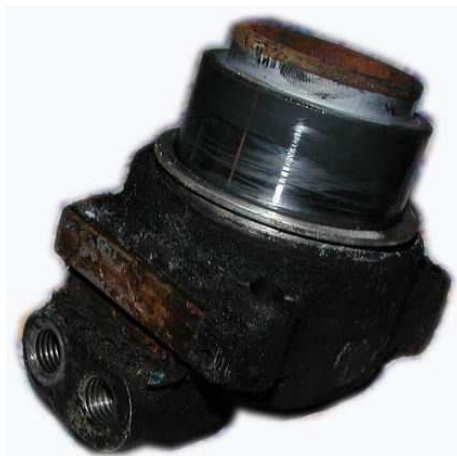
Obr.4 Prasátko před repasí

Po vyndání brzdových prasátek se z nich pokusíme vyndat pístek. Nejlepší je jej vytlačit kompresorem (pozor, po natlakování pístek vylítne velkou rychlostí). Pokud nemáme kompresor, poslouží nám velký hasák a trocha síly. V případě, že je pístek zatuhlý natolik, že s ním nejde pohnout, pomůže opět známý Konkor či WDčko a poněkud větší síla. Jakmile se nám podaří z prasátka pístek vyndat, vyndáme rovnou i těsnící gumičku. Po té vnitřní stěnu prasátka (pokud je znečištěna či zoxidována) přešetíme jemným smirkem tak, abychom odstranili veškeré nečistoty, popřípadě škrábance. Stěna musí být hladká a lesklá. To stejné provedeme i s pístkem.