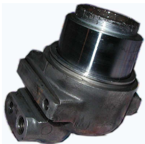
Obr.6 Vyčištěné prasátko

Po vyčištění a přešetření stěn zkusíme pístek zasunout do tělesa prasátka, ovšem ještě bez těsnicí gumičky. Pístek musí chodit naprosto lehce. Pokud se tak neděje, musíme dále čistit, brousit, leštit. Jakmile se nám tento problém podaří vyřešit, můžeme přistoupit k montáži. Do tělesa prasátka vložíme těsnicí gumičku a vnitřek tělesa lehce namažeme olejem. Rovněž stěnu pístku namažeme lehce olejem. Pístek rovně přiložíme na těleso a zatlačíme jej dovnitř. Snažíme se pístek zatlačit rovně, k čemuž doporučuji tlačit přes rovné prkénko. Dále si připravíme prachovku, naplníme ji vazelínou (grafitkou, vazelínou určenou přímo na brzdy či jakoukoli vazelínou co máme zrovna po ruce a víme že neleptá gumu). Prachovku nasadíme na prasátko a pečlivě ji usadíme v drážce. Přebytečnou vazelínu utřeme. Aby prachovka déle vydržela, doporučuji ji stříknout silikonovým olejem. Stejným způsobem připravíme všechna brzdová prasátka.