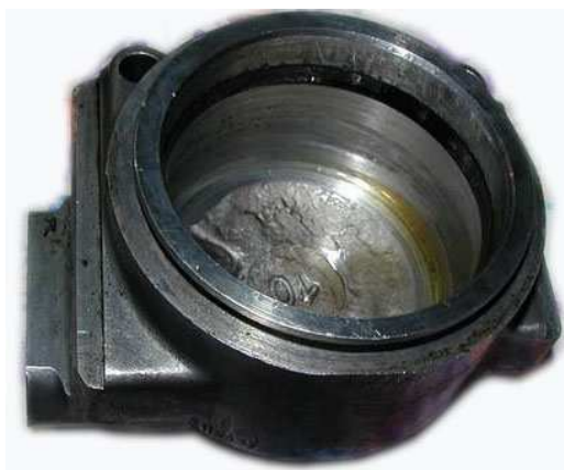
Obr.5 Prasátko s těsnicí gumičkou