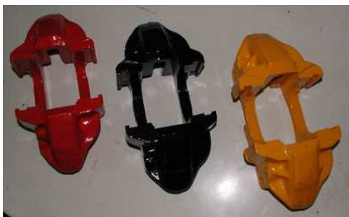
Obr.7 Třmeny nabarvené komaxitem

Jelikož již máme vše připraveno, můžeme začít s konečnou montáží. V brzdovém prasátku nám ještě chybí zajišťovací kolíček (č.6). Díрку pro kolíček naplníme vazelínou, vsuneme pružinku a na ni kolíček. Ten zmáčkne a celé brzdové prasátko nasuneme do brzdového třmenu tak, aby kolíček zaskočil do zajišťovací drážky v třmenu. Totéž uděláme se všemi 4mi prasátky, přičemž si dáváme pozor na to, kam které prasátko patří. Třmeny i všechny 4 prasátka jsou totiž odlišné. Našroubujeme nové spojovací brzdové trubky, nové odvzdušňovací šrouby, popřípadě i čep s pružinkou, brzdovými destičkami a závlačkou (to bych ale nechal až na montáž na autě).