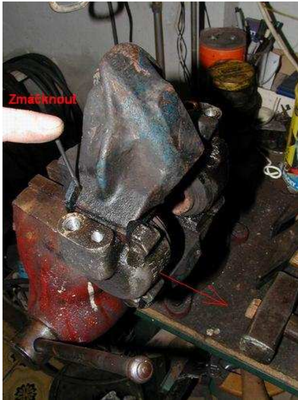
Obr.2 Vyndání prasátka