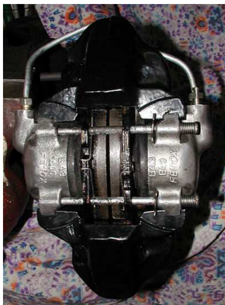
Obr.8 Kompletní třmen